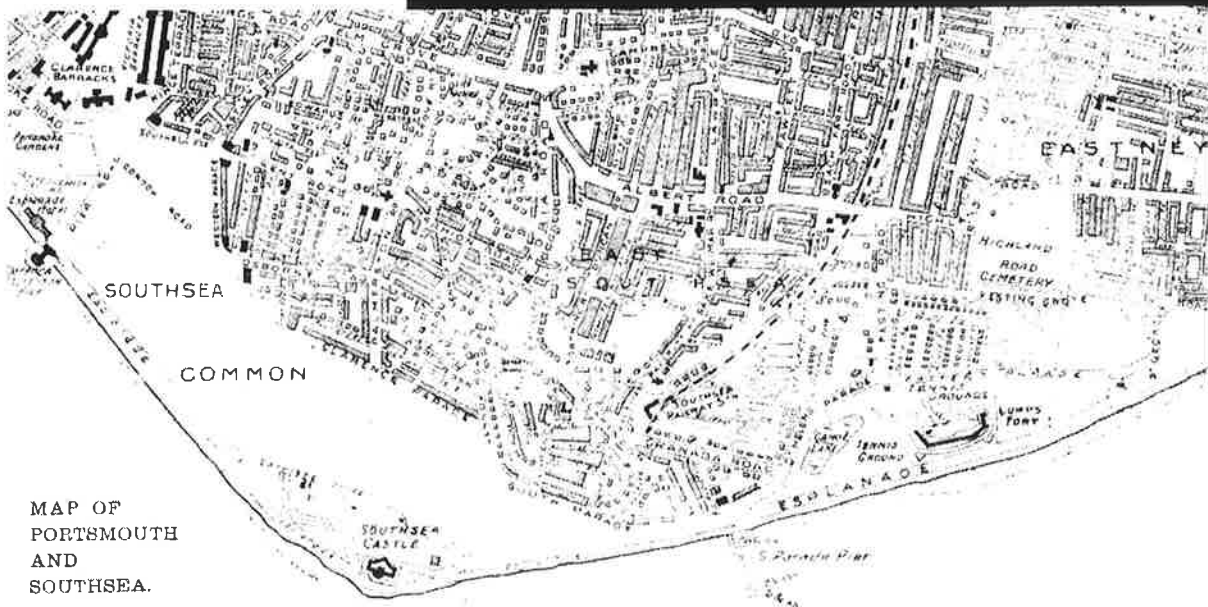
MAP OF PORTSMOUTH AND SOUTHSEA.