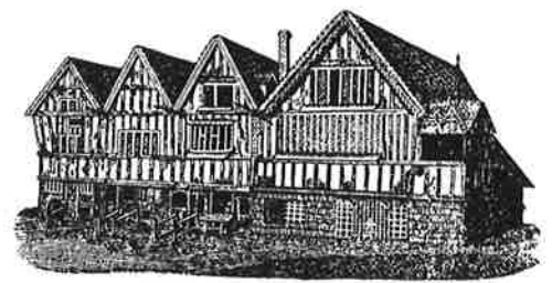
THE TOWN HALL AND PRISON, AS IT APPEARED IN 1711.

[Bristol] Handbook to Bristol , 1898, c. 240 pp.